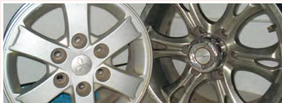
Jantes: 5.000 ECV unidade