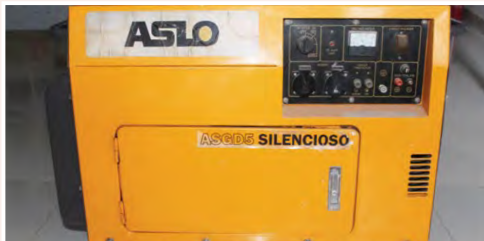
Gerador Aslo Silencioso 5 KVA: 85.000,00 ECV