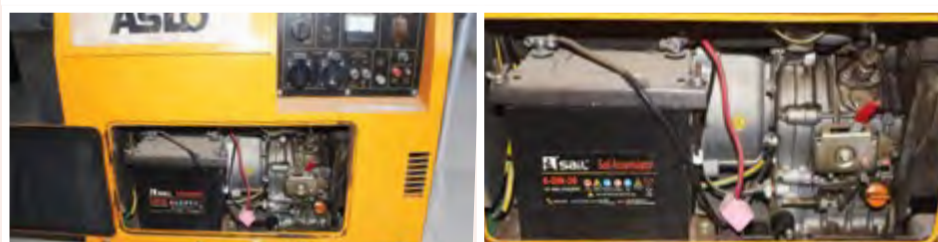
Gerador Aslo Silencioso 5 KVA: 85.000,00 ECV