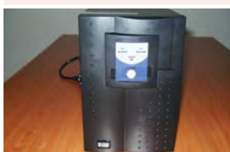
UPS: 25.000 ECV