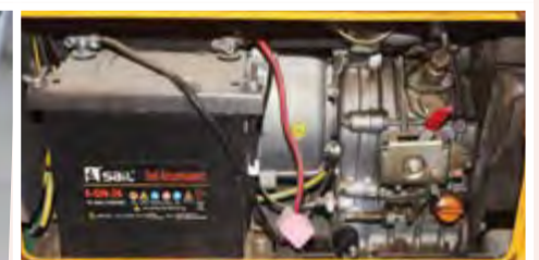
Gerador Aslo Silencioso 5 KVA: 85.000,00 ECV