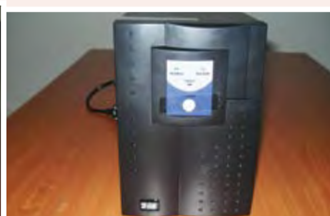
UPS: 25.000 ECV