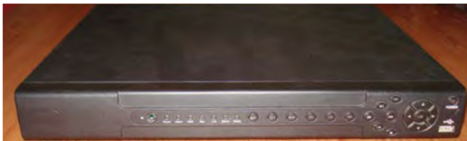
Sistema completo de video vigilância, com 16 câmeras IP: 75.000,00- ECV