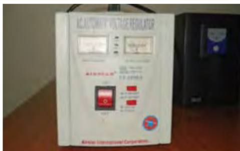
UPS: 25.000 ECV