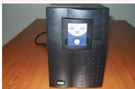
UPS: 25.000 ECV