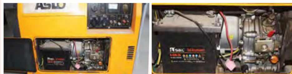
Gerador Aslo Silencioso 5 KVA: 85.000,00 ECV