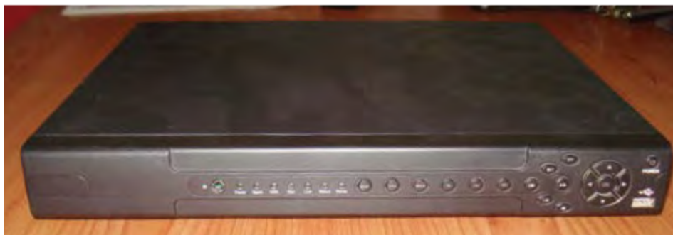
Sistema completo de video vigilância, com 16 câmeras IP: 75.000,00- ECV