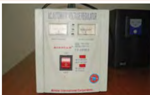
UPS: 25.000 ECV