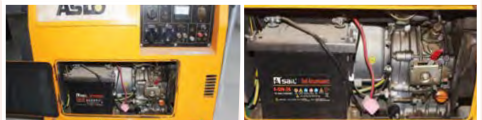
Gerador Aslo Silencioso 5 KVA: 85.000,00 ECV