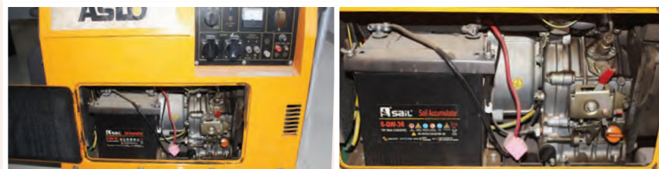
Gerador Aslo Silencioso 5 KVA: 85.000,00 ECV