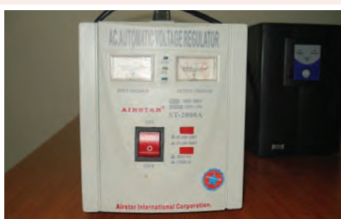
UPS: 25.000 ECV