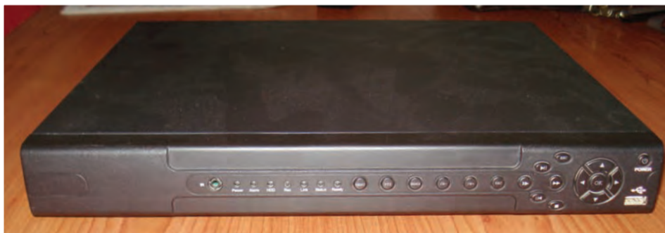
Sistema completo de video vigilância, com 16 câmeras IP: 75.000,00- ECV