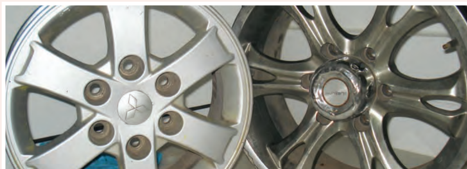
Jantes: 5.000 ECV unidade