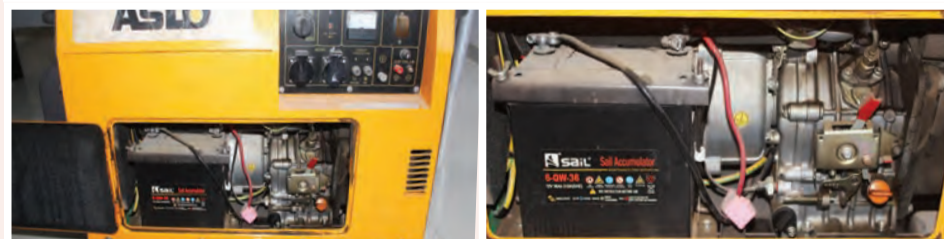
Gerador Aslo Silencioso 5 KVA: 85.000,00 ECV