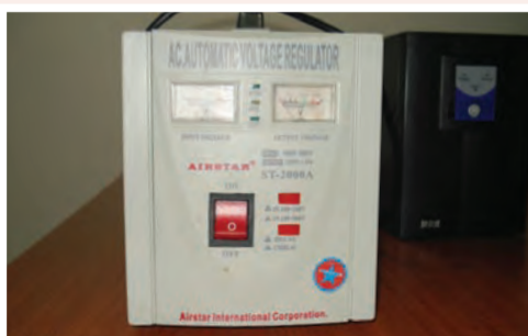
UPS: 25.000 ECV