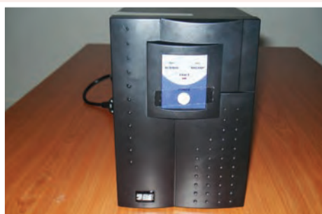
UPS: 25.000 ECV