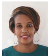
Águeda F. B. C. Resende