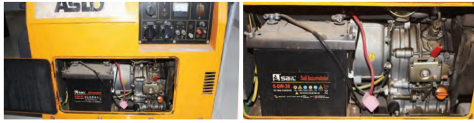
Gerador Aslo Silencioso 5 KVA: 85.000,00 ECV